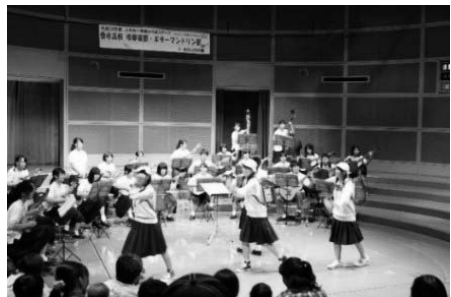
県立香寺高校吹奏楽部とギター・マンドリン