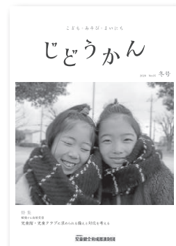
情報誌「じどうかん」